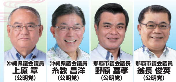
沖縄県議会議員 上原 章 (公明党) 沖縄県議会議員 糸数 昌洋 (公明党) 那覇市議会議員 野原 嘉孝 (公明党) 那覇市議会議員 翁長 俊英 (公明党)