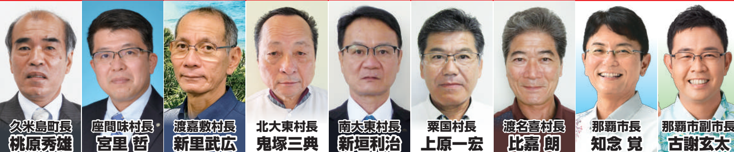
久米島町長 桃原秀雄 座間味村長 宮里 哲 渡嘉敷村長 新里武広 北大東村長 鬼塚三典 南大東村長 新垣利治 粟国村長 上原一宏 渡名喜村長 比嘉 朗 那覇市長 知念 寛 那覇市副市長 古謝玄太